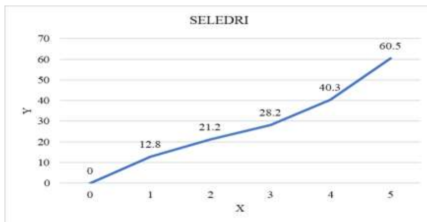
Gambar 2. Grafik Parameter Seledri

Perhitungan AUC menggunakan rumus trapesium berdasarkan rata-rata nilai dari setiap parameter. Dari hasil perhitungan, akan didapatkan grafik dari setiap parameter.