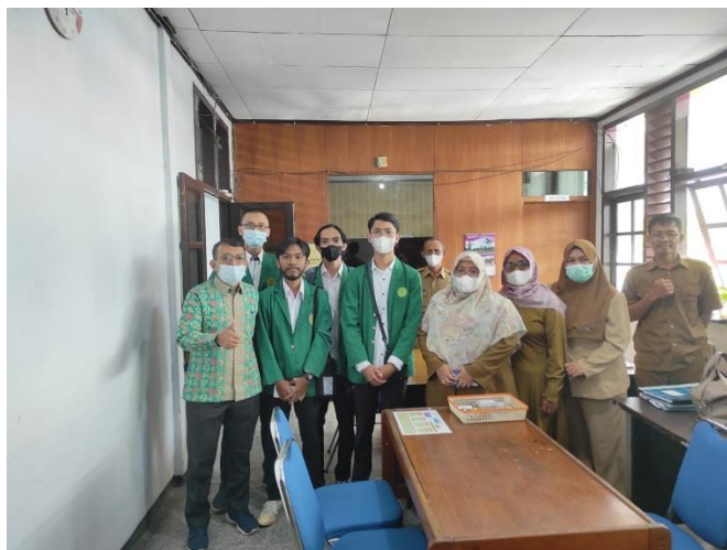
Gambar 1. Tim PKM diterima oleh Pihak Mitra

Pada gambar 1, Tim PKM memulai dengan bersilaturahmi ke kantor Dinas Lingkungan Hidup dan Kehutanan Provinsi Bengkulu, Kami menganalisis tentang kegiatan disana, apa saja yang dikerjakan, apa saja dibutuhkan, namun beberapa waktu mereka terlihat sedikit kesulitan dalam membuat laporan mereka yang sifatnya terkomputerisasi sehingga pelaporan yang dikerjakan tidak dapat selesai lebih cepat dan efisien. Setelah mendapat izin dan diterima oleh pihak mitra, kami segera menyusun strategi kegiatan di kantor tersebut.