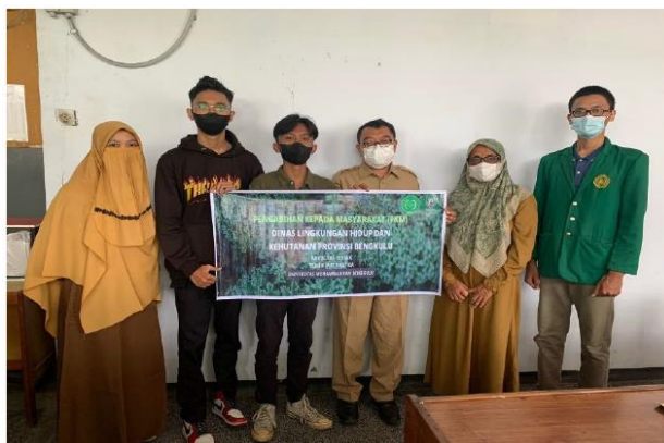
Gambar 2. TIM PKM memulai kegiatan

Pada gambar 1, Tim PKM memulai dengan bersilaturahmi ke kantor Dinas Lingkungan Hidup dan Kehutanan Provinsi Bengkulu, Kami menganalisis tentang kegiatan disana, apa saja yang dikerjakan, apa saja dibutuhkan, namun beberapa waktu mereka terlihat sedikit kesulitan dalam membuat laporan mereka yang sifatnya terkomputerisasi sehingga pelaporan yang dikerjakan tidak dapat selesai lebih cepat dan efisien. Setelah mendapat izin dan diterima oleh pihak mitra, kami segera menyusun strategi kegiatan di kantor tersebut.