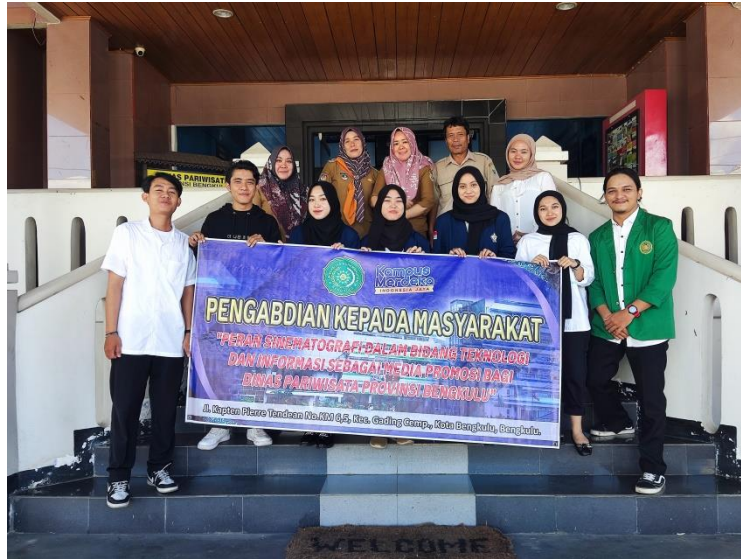
Gambar 2. TIM PKM memulai kegiatan

Setelah Tim PKM mendapatkan izin dari pihak kantor dan berkoordinasi tentang permasalahan mitra maka selanjutnya Tim PKM menyusun materi praktek yang akan diajarkan. Mulai dari proses editing sederhana menggunakan Adobe Premiere Pro , hingga menambahkan fungsi tools – tools yang ada.