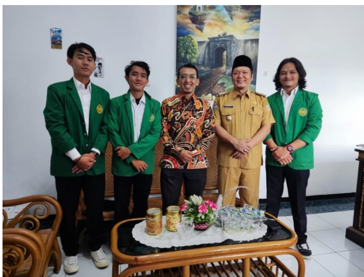
Gambar 1. Tim PKM diterima oleh Pihak Mitra

Pada gambar 1, Tim PKM memulai dengan bersilaturahmi ke kantor Dinas Pariwisata Provinsi Bengkulu, Kami menganalisis tentang kegiatan disana, apa saja yang dikerjakan, apa saja dibutuhkan. Setelah mendapat izin dan diterima oleh pihak mitra, kami segera menyusun strategi kegiatan di kantor tersebut.