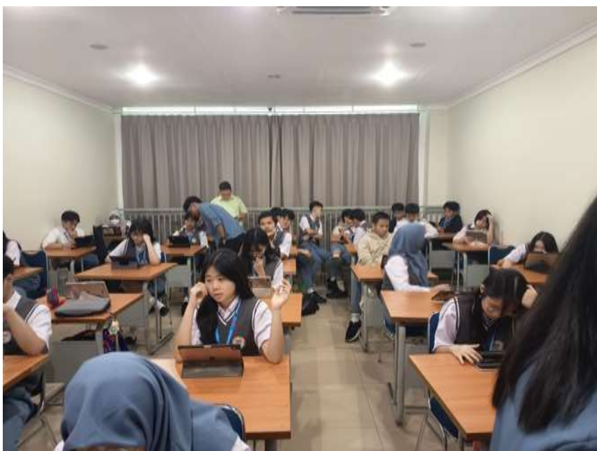
Gambar 2. Siswa sedang Melakukan Pelatihan