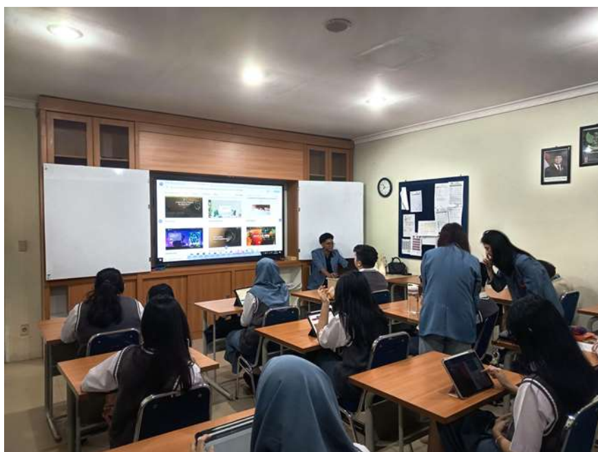
Gambar 1. Siswa sedang Menyimak Materi

Kegiatan PKM ini dihadiri oleh Rionaldi Halim, S.Kom. selaku Guru Informatika, dan Anita Saragih, S.Si selaku Guru Matematika di SMA Kusuma Bangsa. Dengan adanya sedikit pesan dari Rionaldi Halim, S.Kom. agar kegiatan pelatihan ini dapat memberikan manfaat yang signifikan bagi siswa dan masa depan mereka. Kegiatan ini terdiri dari dua sesi, yaitu sesi pengenalan dan sesi praktik. Pada sesi pengenalan, mahasiswa memberikan penjelasan tentang pengertian website, manfaatnya dalam dunia pendidikan dan sosial, serta langkah-langkah dasar pembuatan website menggunakan Wix berdasarkan PowerPoint dan ditampilkan melalui televisi digital yang sudah disiapkan. Sedangkan pada sesi praktek, siswa langsung diarahkan membuat akun Wix, memilih template, menambahkan elemen-elemen penting seperti teks, gambar, dan tombol, serta mempublikasikan website mereka secara mandiri.