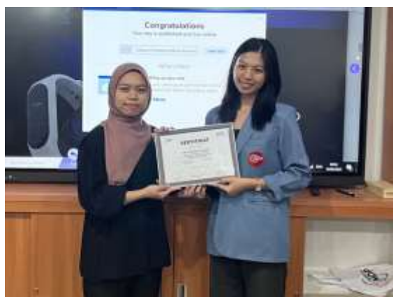
Gambar 4. Pemberian Sertifikat

Terakhir, tim memberikan cinderamata untuk SMA Kusuma Bangsa berupa sertifikat sebagai ucapan terima kasih telah diizinkan Pengabdian Kepada Masyarakat (PKM) dengan judul "Pelatihan Pembuatan Website Sederhana dengan Aplikasi Wix Di SMA Kusuma Bangsa". Kegiatan ini ditutup dengan sesi foto bersama.