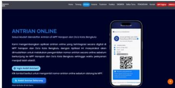
Gambar 4. 3 Antrian Online pada aplikasi MPP Kota Bengkulu

dibutuhkan koordinasi yang efektif serta efisien dalam melaksanakan kegiatan dan kelembagaan. Dalam penyelenggaraan Mal Pelayanan Publik di Kota Bengkulu untuk melihat bagaimana koordinasi antar Lembaga dan instansi peneliti akan menjelaskan dengan menggunakan indicator.