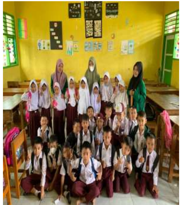
Gambar 7. Foto bersama

bahkan jika itu sudah menjadi kebiasaan bagi anak, anak akan selalu mencuci tangan secara benar sebelum makan. Anak pun akan belajar dan bertumbuh kembang secara positif. Cuci tangan yang baik dan benar juga sangat diperlukan bukan hanya menghindari anak dari virus dan bakteri akan tetapi juga akan meningkatkan tumbuh kembang anak secara optimal.