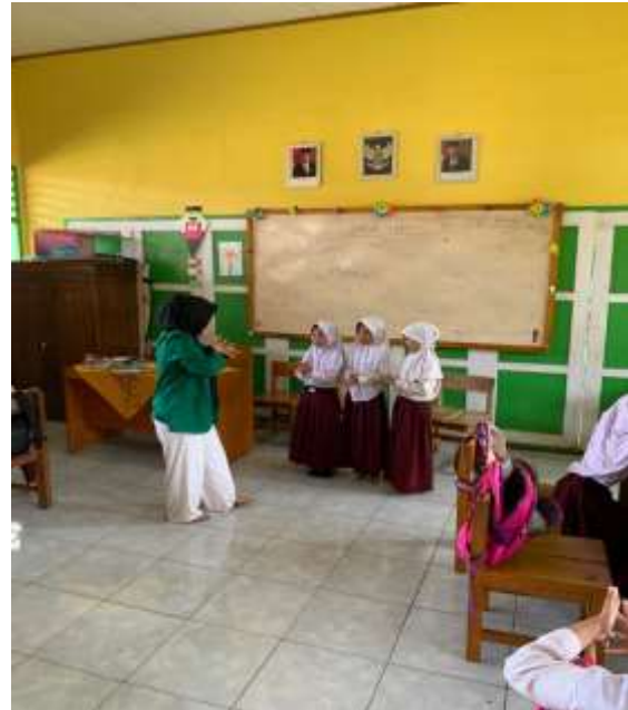
Gambar 4. Mempraktekan cara mencuci tangan