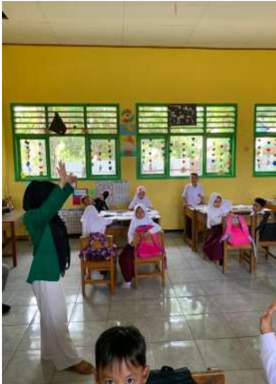
Gambar 2. Penyampaian pemateri ke 1