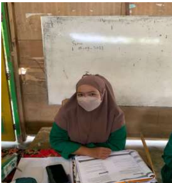
Gambar 3. Penyampaian pemateri ke 2