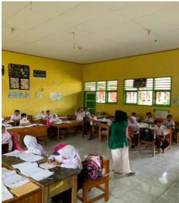
Gambar 1. Sebelum sosialisasi dimulai dibuka dengan pemateri yang akan melakukan kegiatan

Penyuluhan ini berisi materi tentang mencuci tangan yang baik dan benar mencuci tangan yang baik dan benar adalah salah satu untuk memenuhi salah satu langkah untuk menerapkan hidup sehat agar terhindar dari bakteri dan kuman, peserta sangat antusias mengikuti kegiatan sosialisasi. Hal ini terlihat saat anak-anak mengikuti sesi tanya jawab dan mempraktekan langsung kedepan.