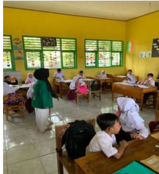
Gambar 5. mengajak bermain anak-anak sambil mempraktekan