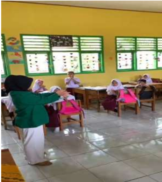
Gambar 6. Memberikan contoh mencuci tangan yang baik dan benar

Evaluasi hasil penelitian sosialisasi mencuci tangan yang baik dan benar pada anak-anak SD 018 Bengkulu Utara yang dilaksanakan pada tanggal 3 Agustus 2022. Kegiatan ini berlangsung sekitar 1 jam setengah dengan jumlah peserta 28 anak. Setiap anak memperhatikan sosialisasi dengan baik.