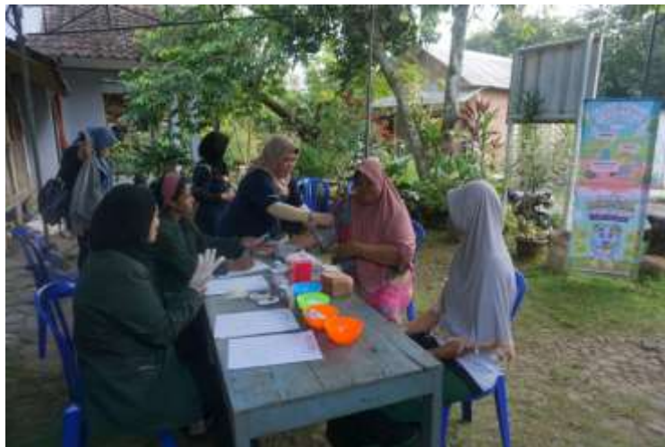
Gambar 2. Kegiatan Pemeriksaan Tekanan Darah

Setelah sesi penyuluhan dan evaluasi selesai, kegiatan dilanjutkan dengan pelaksanaan screening kesehatan berupa pemeriksaan tekanan darah sebagai bentuk implementasi nyata dari upaya preventif yang telah disampaikan sebelumnya. Kegiatan screening kesehatan memegang peranan penting dalam upaya pencegahan dan pengendalian penyakit secara dini. Selain mendeteksi penyakit pada tahap awal, kegiatan screening juga berkontribusi dalam meningkatkan pemahaman masyarakat mengenai kondisi kesehatan mereka (Silvitasari et al. , 2021). Secara umum, screening kesehatan berperan penting dalam sistem pelayanan kesehatan, terutama dalam upaya deteksi dini penyakit, peningkatan kesadaran masyarakat terhadap kesehatan, serta penurunan angka kejadian penyakit. Pelaksanaan program screening dapat dimaksimalkan sehingga memberikan dampak positif yang lebih luas terhadap derajat kesehatan masyarakat secara keseluruhan.