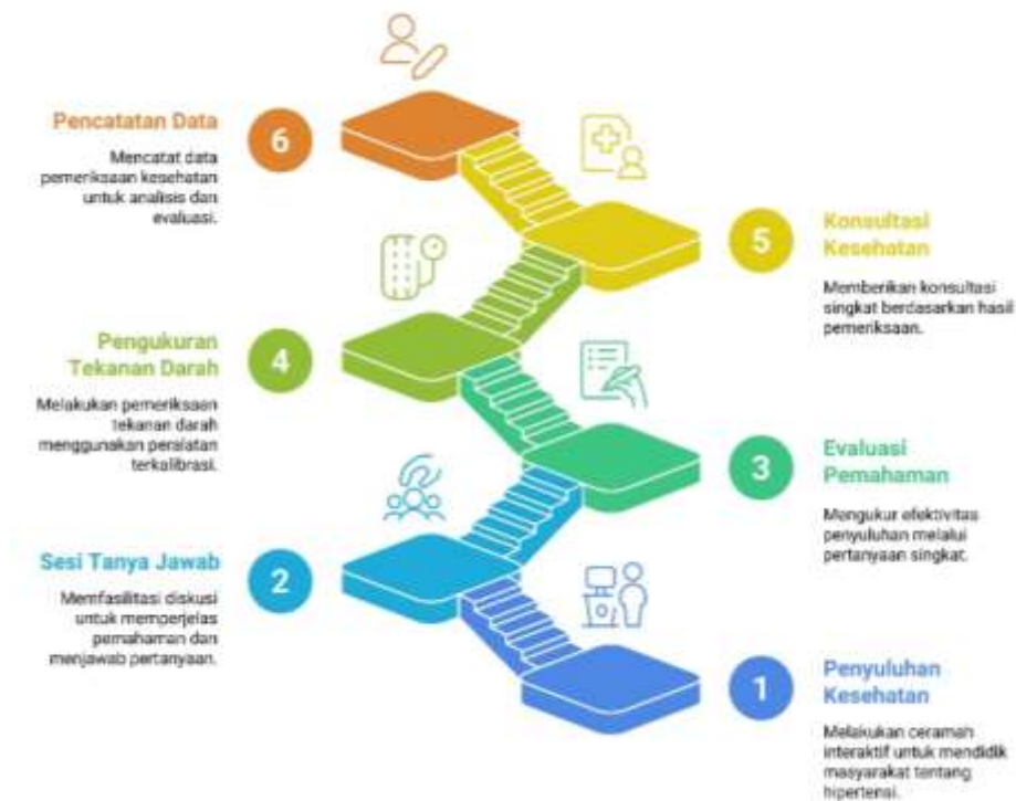
Gambar 1. Tahapan Pelaksanaan Pengabdian Kepada Masyarakat

Pelaksanaan kegiatan berlangsung pada tanggal 4 Mei 2025 dilaksanakan dalam dua tahap. Tahapan pelaksanaan pengabdian kepada masyarakat disajikan pada Gambar 1. Tahap pertama berupa penyuluhan dengan metode ceramah menggunakan media Powerpoint, kemudian dilanjutkan dengan sesi tanya jawab topik mengenai hipertensi. Tahap kedua merupakan inti kegiatan, yaitu pemeriksaan kesehatan ( screening ). Sasaran kegiatan ini adalah warga yang berdomisili di wilayah Desa Jayan, Boyolali. Penyusunan laporan pertanggungjawaban dilakukan sebagai bentuk dokumentasi pelaksanaan kegiatan, yang bertemakan “Pemeriksaan Tekanan Darah Sebagai Upaya Preventif Kesehatan Masyarakat Untuk Meningkatkan Kesadaran Terhadap Pola Hidup Sehat”.